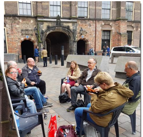
eten en drinken