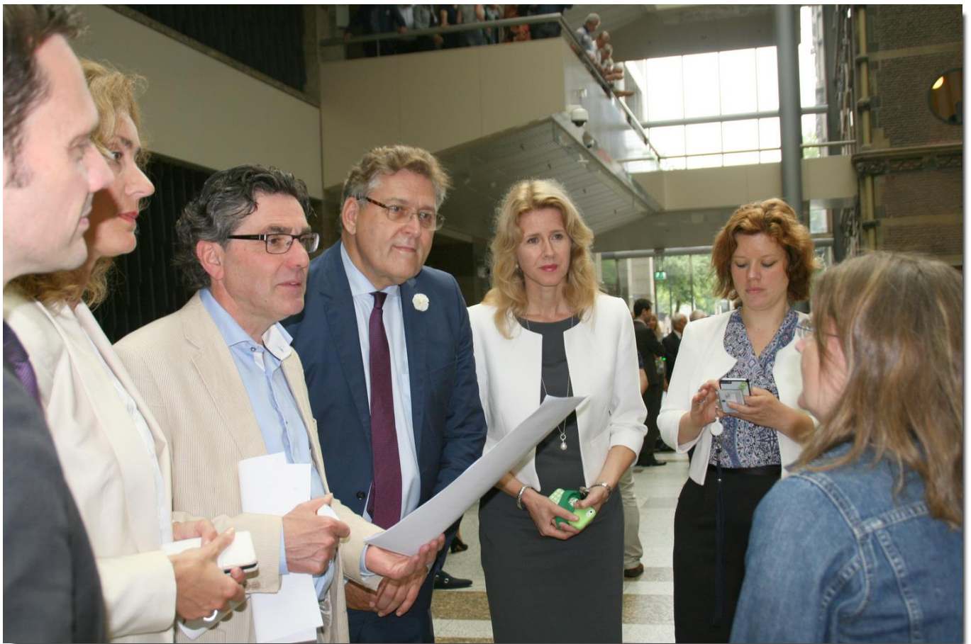
praten over het manifest