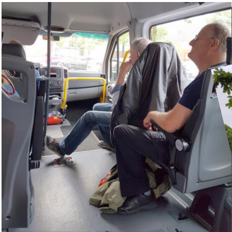
onderweg naar Den Haag